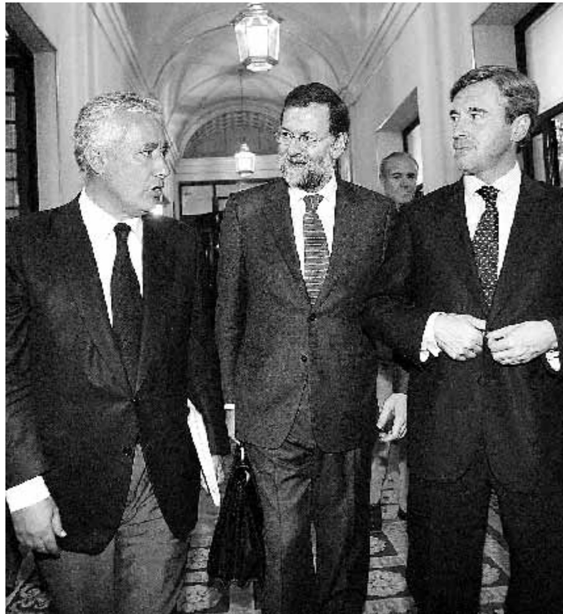
DECISIVO. A la izquierda, Arenas, Rajoy y Acebes se dirigen al hemiciclo momentos antes de iniciarse el debate. A la derecha, el presidente andaluz, Manuel Chaves, y el consejero

La nueva norma de la UE que limita el equipaje de mano en los vuelos entrará en vigor el lunes