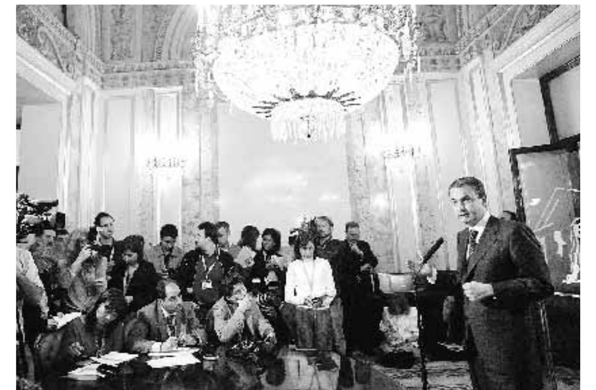
EXPECTACIÓN. Zapatero, en la rueda de prensa que ofreció ayer.

El presidente andaluz se mostró molesto con ciertas palabras de Rajoy