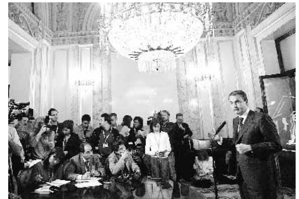
EXPECTACIÓN. Zapatero, en la rueda de prensa que ofreció ayer.

El presidente andaluz se mostró molesto con ciertas palabras de Rajoy